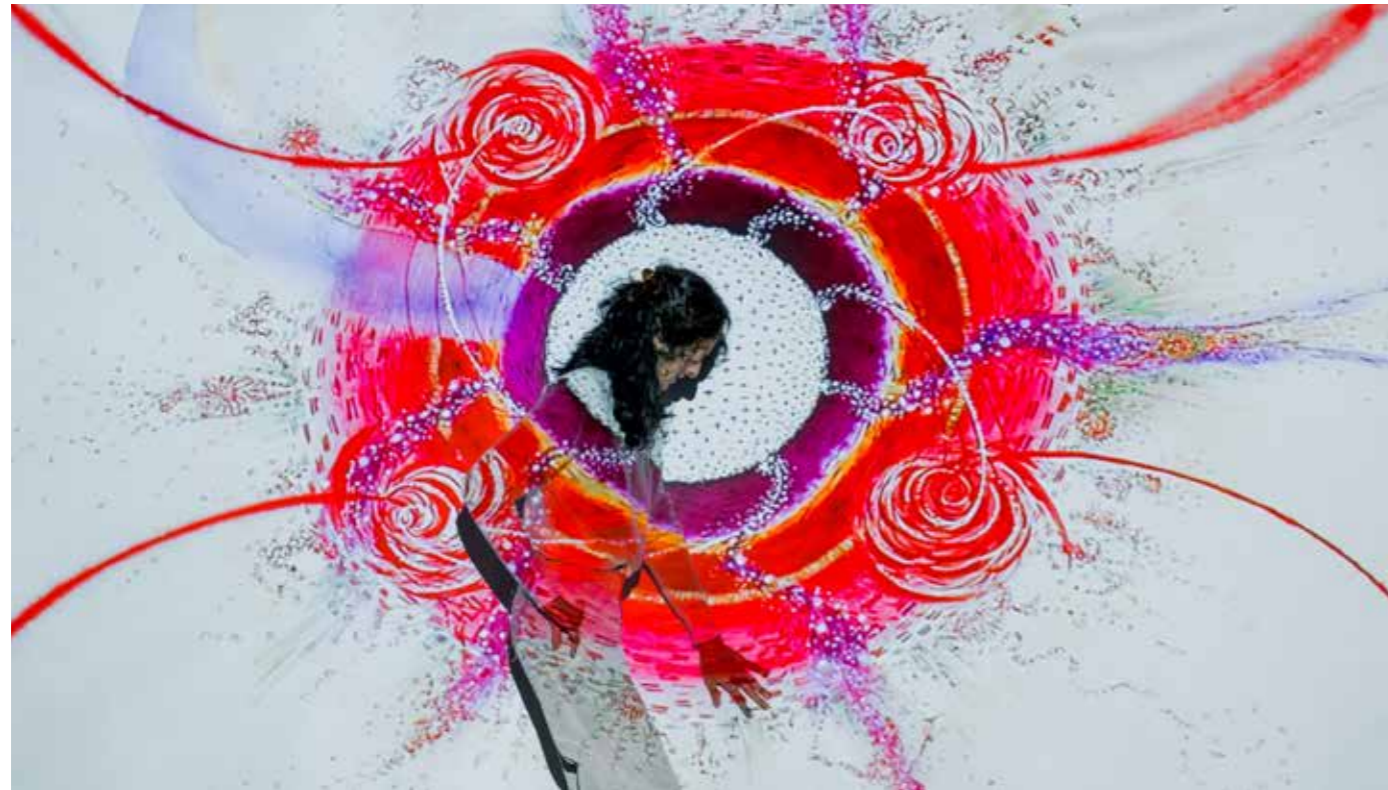
Con: Eulàlia Valldosera , artista y mediadora

Una conferencia performativa en la que el artista pone en práctica su faceta de mística activista. Siguiendo su conocida investigación sobre el mecanismo de la percepción, nos guía en un viaje para comprender el fenómeno de la visión y la canalización dando voz a la línea y el color.